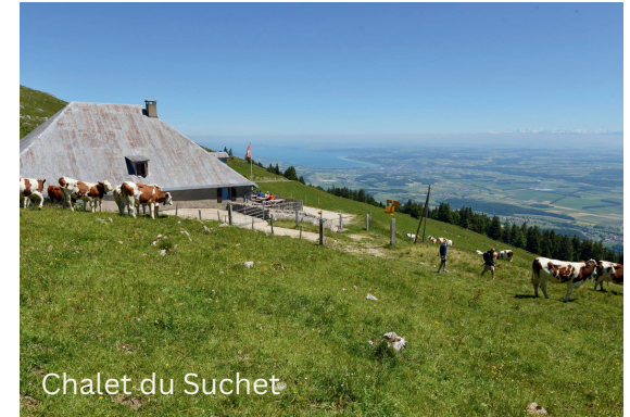
Chalet du Suchet